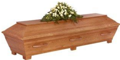
Kista i furu, målad antik brun. (Sandholm)