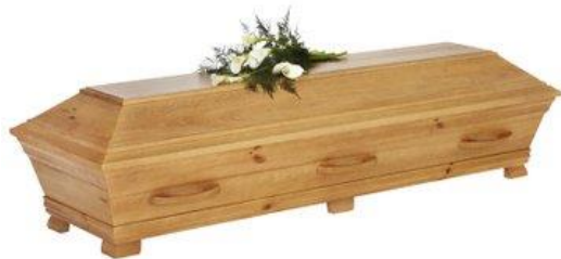
Kista i furu, ek bets. (Alvö)