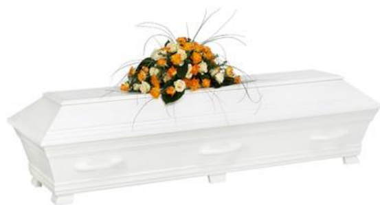
Kista furu, solidvit (Alvö)

Kistdekoration som är på bilden ingår ej.