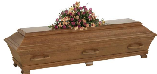
Kista i massiv ek, betsad (Ekenäs)

Kistdekoration som är på bilden ingår ej.