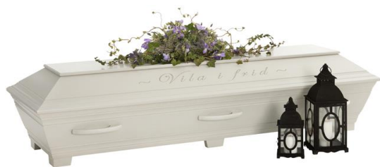
Kista i furu, mätad, (Kullamark) Allmogegrå med avskedshälsning ingraverad