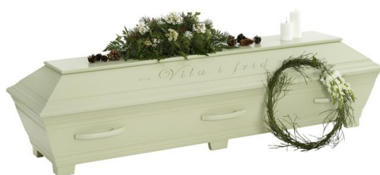
Kista furu, Lindblomsgrön (Kullamark) med avskedshälsnings ingraverad

Kistdekoration som är på bilden ingår ej.