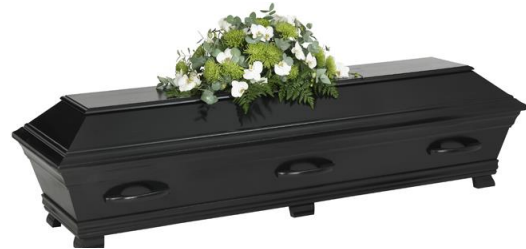
Kista furu, lackad i solidfärg, svart (Hovdala)

Kistdekoration som är på bilden ingår ej.