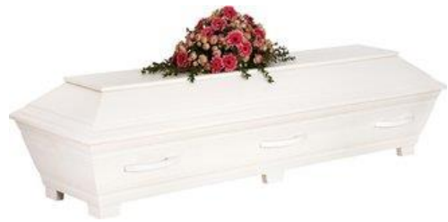
Kista furu, målad vit. (Sandholm)

Kistdekoration som är på bilden ingår ej.