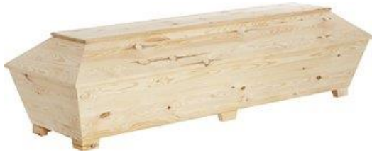
Kista i ren obehandlad furu. (Ängsro)