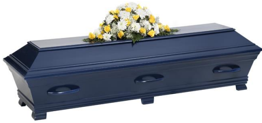
Kista i furu, lackad i solidfärg, midnattsblå (Hovdala)