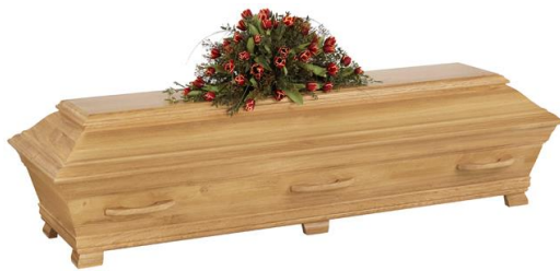
Kista i massiv ek, siden matt. (Ekenäs)